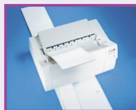
Egyszerre háromféle leprellő is befűzhető és leprellővágóval is felszerelhető

A T2265 és a T2280 már alapfelszereltségben tud vonalkódot és extra méretű karaktereket (LCP) nyomtatni továbbá a számtalan interfész, emuláció ill. egyéb kiegészítők alkalmazásával tulajdonképpen minden rendszerhez illeszthetőek.