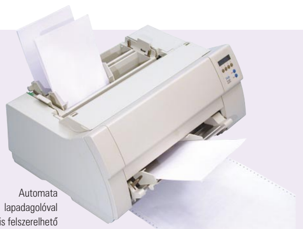
Automata lapadagolóval is felszerelhető

A T2265 és T2280 printerek a TallyGenicom hagyományoknak megfelelően rendkívül sokoldalú papírkezeléssel rendelkeznek. A lapbefűzés egyszerűen előlről végezhető el. Nem kell a nyomtató mögé furakodva, vagy a printeren áthajolva küzdeni ezzel. Kiegészítő traktor segítségével egyszerre két leprellőt is képesek automatikusan kezelni. T2280-2T modell pedig akár háromféle leprellőformátum egyidejű befűzését is lehetővé teszi. Ám ezek a printerek nemcsak leprellő nyomtatására alkalmasak, hanem vágott lapokat is befogadnak. Egyszerre lehet leprellőt is befűzni és opcionálisan egy- vagy kéttálcás - egyenként 190 lapos - automata lapadagolóval csatlakoztatni. A kiadott utasításnak megfelelően a nyomtatók automatikusan választják ki a kívánt papírméretet. Az egyenes papírútnak köszönhetően a bosszantó és időt rabló papírelakadások esélye minimális.